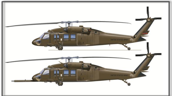
U.S. Army Afghanistan 2011